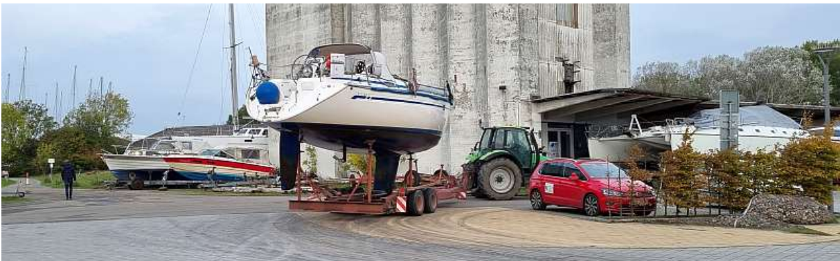
... in 150 Tagen sind wir wieder da!